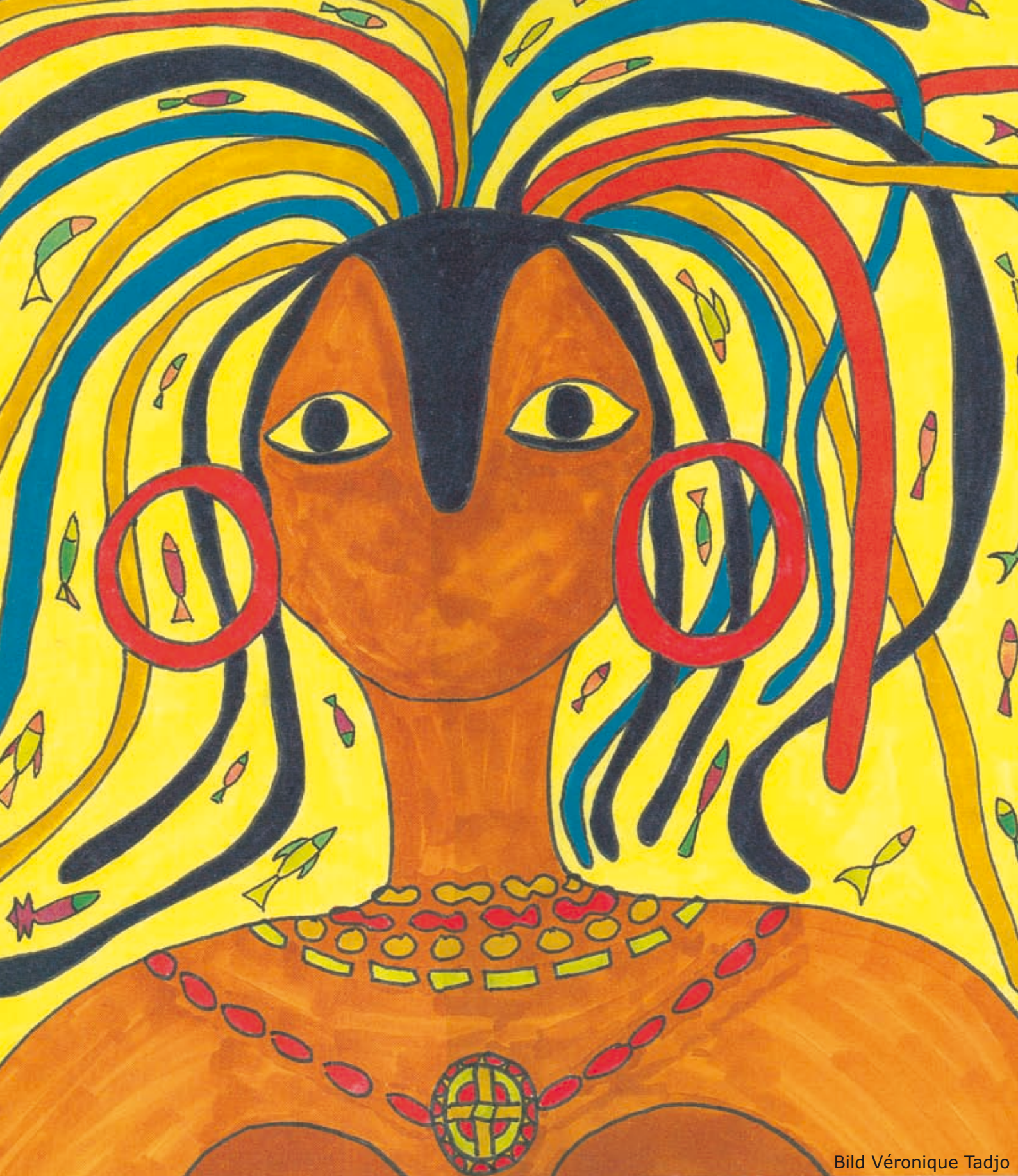
Bild Véronique Tadjo