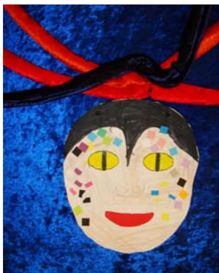
Mamy Wata och fiskar på blå fond.

Eller gör en stor Mamy Wata med hål för ansikte så barnen kan låtsas vara Mamy Wata själva. En ritrulle är perfekt och/eller en skärm av kartong. Sjöjungfruns stjärt kan man dekorera med glittrande papper, eller paljetterade tyger. Mamy Watas hår är sjöormar – testa att rulla stretchplysch i olika färger, det är ett härligt material som går att använda till mycket.